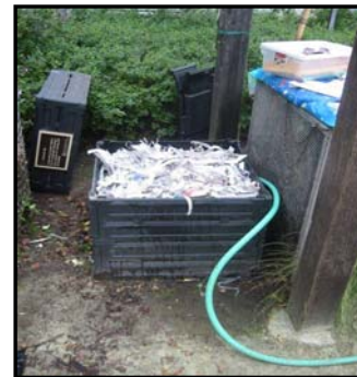
Recipiente para el Tratamiento de los residuos orgánicos

De acuerdo al sistema de compostaje a utilizar varían los materiales que pueden ser introducidos. Sin embargo, en general deben evitarse las sustancias que puedan atraer pestes como carnes, lácteos y otros productos de origen animal, plantas infectadas con plagas y desechos de perros o gatos.