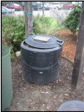
Recipiente para el Tratamiento de los residuos orgánicos

El compostaje domiciliario es un método para convertir los desechos del hogar, como son los restos de comida y/o los restos de poda, en compost. Las fotos siguientes muestran algunos de estos sistemas.