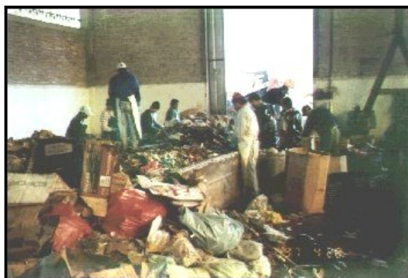
Línea de separación

El programa comenzó con una campaña educativa utilizando los medios locales con el fin de promover la separación de los residuos orgánicos en origen. Con el fin de evaluar la viabilidad del programa, se comenzó con un proyecto piloto que incluía unas 120 viviendas. Un grupo de jóvenes fueron los encargados de repartir el material didáctico a los vecinos, de mantener conversaciones, y entregar una cartilla donde se describen los materiales a disponer en cada bolsa, y finalmente el grupo llevó a cabo una encuesta. Luego del éxito alcanzado en esta región, la zona de influencia se fue expandiendo hasta alcanzar las 3,5 toneladas de residuos diarios tratados.